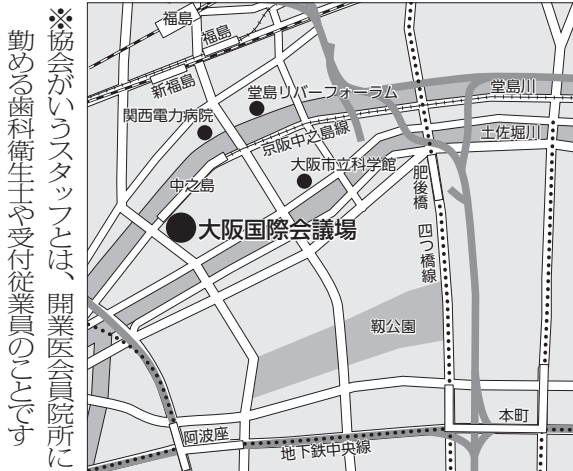
※協会がスタッフとは、開業医会員院所に勤める歯科衛生士や受付従業員のことです。 京阪電車中之島線「中之島」駅すぐ、JR大阪環状線「福島」駅徒歩15分、地下鉄「肥後橋」・「阿波座」駅徒歩15分

4月の診療報酬改定に向け協会は新点数中央説明会を3月21日、大阪府立国際会議場(グランキューブ大阪)で開く。今改定では新たに「かかりつけ歯科医機能強化型診療所」が設けられる。施設基準に新たな「研修」が盛り込まれ、点数に格差がつけられようとしている。歯科疾患管理料や補綴時診断料などは、保団連・協会の要望が取り入れられ算定要件が変更される。ブリッジで4番が支台歯の前装冠や大白歯のCAD/CAM冠が一部認められるようになり、前歯部のシェードを決める色調採得検査や舌圧測定、有床義歯咀嚼機能検査などが示されている。さらに選定療養の拡大も加わる。