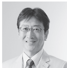
大阪大学歯学研究所長・歯学部長 予防歯科学教授

H学部部長と意気投合したのは、歯科医師過剰は過ぎ、あと10年で歯科医師不足に転じる(その根拠はいずれまた)。歯科医師ワーキングプアの報道があつて以来、歯学部どころか、歯科衛生士人気が、技工士人気にも陰りが出た。しかし、ここ数年、うちの歯学部の入試倍率はV字回復。これから再び優秀な受験生が歯学部を目指してくれるだろう。そつだ、読者諸兄にも手を貸して戴きたい。歯学部人気復活のカギは、世間が歯科医を羨むことである。院長先生達には街に出て大いにお金もちぶりをアピールして欲しい(くれぐれも上品に)。これで関西地区歯学部の偏差値は上がるに違いない。