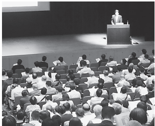
420人参加した研修会の様子＝6月16日、阿倍野区民センター

社保研究部は、「初診料の注1」と「歯科外来診療環境体制加算1、2」の施設基準に係る研修会を阿倍野区民センターで6月16日に開催した。中原寛和氏(大阪市立大学大学院歯学研究所口腔外科教授)を講師に420人の会員が参加した。研修会終了後に同施設基準の届出に必要な修了証を発行した。