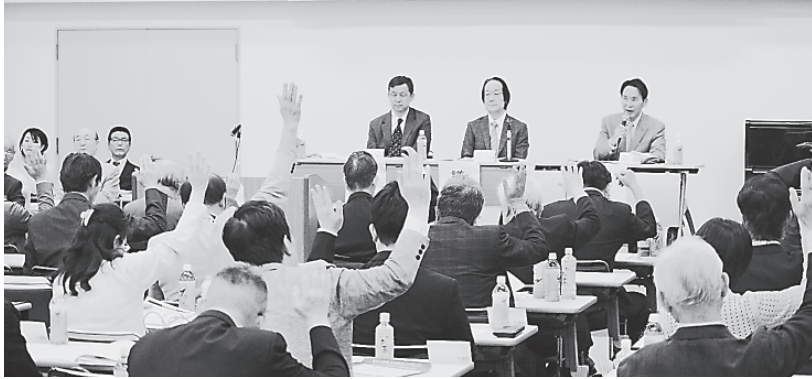
すべての議案を全員一致で可決した第54回通常評議員会 = 5月19日、M&Dホール