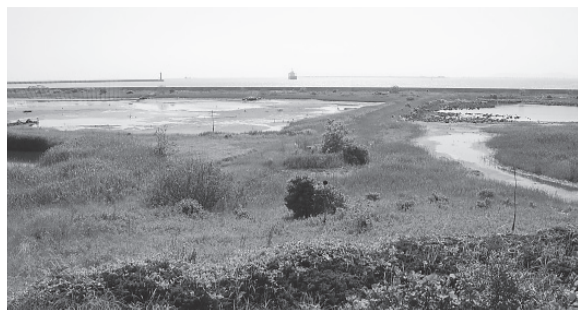
展望塔から絶滅危惧種の貴重な野鳥も時折飛来する人工干潟が一望できる (園内)

南港ポートタウン線ト リードセンター前駅を下 車し、徒歩約15分のご ろに大阪南港野鳥園が見 えてくる。大阪南港周 辺は、かつて住吉浦とい う自然豊かな土地であ った。現在は人工干潟とな ったものの、多くの渡り鳥 の飛来地として日本屈指 の存在だ。1983年「南 港の野鳥を守る会」の熱 意により当時埋め立て中