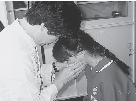
図2 検出健診から学習歯科健診へ歯に由来する感染を顎下リンパ節の触知で動機づける

「でも」と言っても届きません。教師の行動変容は歯科医師の言葉による説明ではなく、リンパ節を直接触れることで始めて起こります。これが教育する学校にふさわしい学習健診です。(図2) 学校保健法では健診の対象者は児童生徒と学校教職員すべてと定められています。多くの先生たちが歯周病でリンパ節を腫らしています。無症状に見える歯周病でリンパ節の腫れに気付くと先生たちに行動変容が起こり、やがて学校全体でむし歯や歯周病の治療とセルフケアを学校の課題として取り組み始めます。