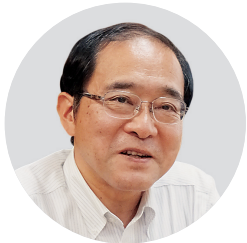
西晃・帯同弁護士団団長