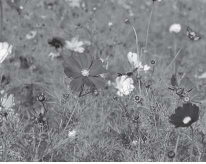
右からヒツジ、シカ、イノシシ、ライオンの頭蓋骨格(上)と咲き乱れるコスモス(下)

博物館は、長居公園植物園の一角にあり、1974年(昭和49年)にオープンし、今年10月10日に入館者数が1000万人を突破したとのこと。