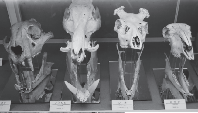
東住吉区の長居公園にある大阪市立自然史博物館を訪れた。