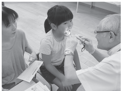
歯の悩みに答えた枚方市での健康教室=8月4日