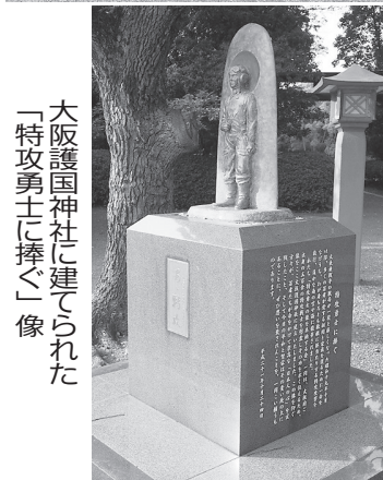
大阪護国神社に建てられた「特攻勇士に捧ぐ」像

の駆逐艦も海に消えた。ガダルカナル島の戦いで死者・行方不明者約2万人強、このうち直接の戦闘での戦死者は約5千人、残り約1万5千人は「餓死した英霊たち」であ