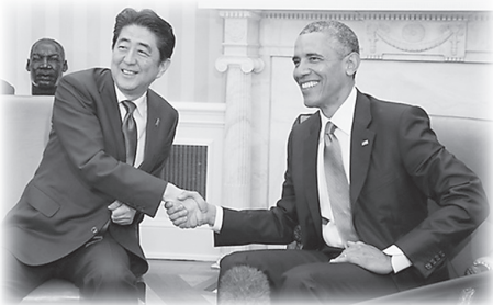
安倍首相は4月の訪米で自衛隊による支援拡充を約束

とに武力行使にも及ぶこととなる。自衛隊の行う支援は、物資の補給、兵隊や武器・物資の輸送、補修・整備、通信、医療等の後方支援や捜索活動などである。これまで行えなかった米軍等への弾