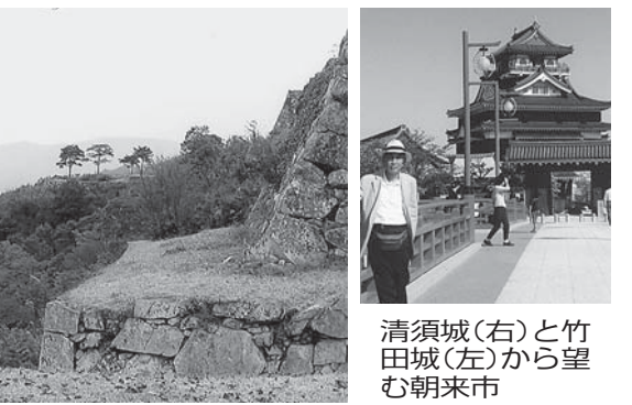
清須城(右)と竹田城(左)から望む朝来市

「哀愁が漂って、美しくかった」 40〜60代の頃は、週二でコースに出るほどのゴルフ党。方向転換のきっかけは、「球が飛ばなくなった」から。