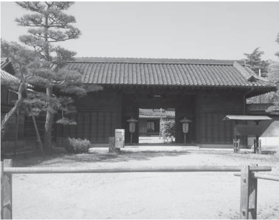
会所は鴻池家が開発した新田の管理・運営をおこなった