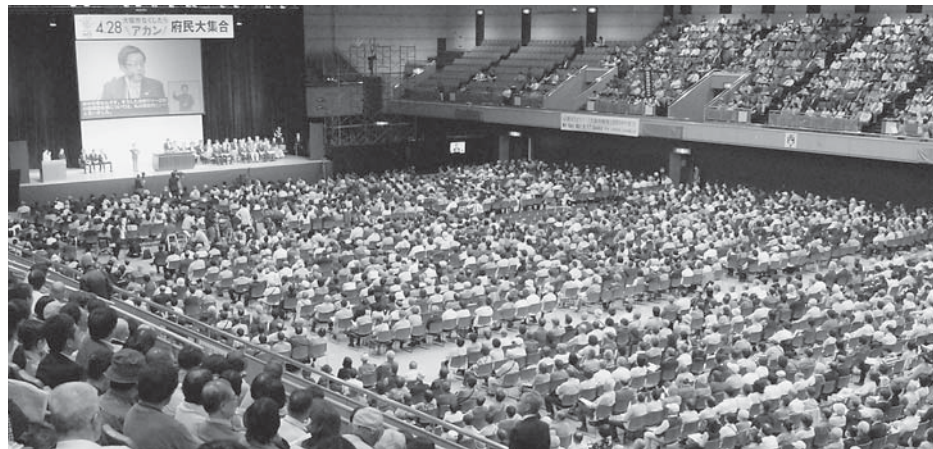
約6千人の市民が集まり、「大阪市なくしたらアカン」とアピールした集会＝4月28日、大阪市内

大阪府を廃止して権限と財源を奪う「大阪市廃止・分割」構想の住民投票が17日に実施される。同構想が実施されれば今後の医療・福祉政策に重大な影響を及ぼすことから、協会は「反対」の審判を下すよう呼びかけている。 (関連2・4面)