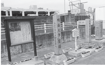
上：占領軍の飛行場だった靴公園 下：江之子島対岸川口二丁目「大阪開港の地」碑、「大阪電信発祥の地」碑などが並ぶ

大阪大空襲で焼け野原となった。戦前はまた「なにわ筋」が建設されておらず、現在の靴公園の東側と西側は一つだった。 戦後、占領軍は戦前からの南北幹線道路である四つ橋筋―あみだ池筋間敷地は大阪市へ返還さ れ、戦後復興土地地区画整理事業によって55年に靴公園が開園した。 空襲に消えた江之子島旧府庁 初代の大阪府庁は今の中央区本町2丁目付近に あった。江戸幕府の西町奉行所を流用したものでしたが、手狭で1874年(明治7年)に西区江之子島に移転した。 この二代目の旧府庁舎は、造成寮(現在の財務省造幣局)のイギリス人技師が設計したもので、中央に円形ドームがそびえた白亜の西洋館だった。現庁舎本館一階に模型が展示してある。大阪市民はここを「江之子島政府」と呼んでいた。待合室を「人民控所」と呼び、職員が高圧的な役人風を吹かせていたからだ。世間の俗称とはいえず、地方行政庁舎を「政府」 と呼ぶ例は他にない。1926年(大正15年)に現在の大阪城近くの大手前に移転してから、大阪府工業奨励館などとして使われ、45年3月の大空襲で焼失した。 2011年の舎跡の発掘調査で、空き地の地下数メートルに、中央棟と南北両棟の地下のレンガ壁や、花崗岩を組み合わせた中央棟の円形ドームの基礎部分(直径約6m)、レンガ積み暖炉などが100年以上前の姿を現した。歴史的価値が高いと評価され、移築保存されることになっている。