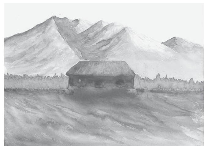
絵 藤田 進 (河内長野市)

そこに立った時、意外に狭いと思った。子どもの目には大きな家で家の前には小川が流れていたと思っていたが、記憶と現実がどうも結びつかない。