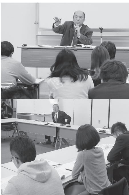
新規開業医を対象に開いた指導対策講習会(上)と雇用講習会(下)

「日頃から保険ルールの勉強に備えて、指導の通知が来たら協会に連絡をしてほしい」と訴えた。従業員が安心して働ける環境整備こそが信頼関係の構築であり、定着につながるの、労働基準法に適した就業規則を作成し、周知と日頃の運用が大切であるとした。