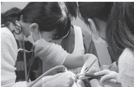
歯科医・助手・患者役に分かれて取り組んだバキューム実習 = 1月31日、港区内

臨床・学術部は歯科医のスタッフ向け実習講座「バキュームテクニク」を大阪市内の市港区のとみもと歯科で、2月1日に「シャープニングセミナー」を保険医会館でそれぞれ開いた。のべ28人が参加した。