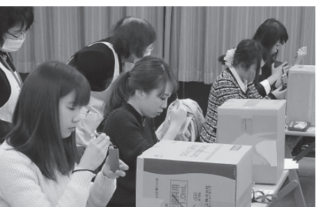
講師の指導を受けながらシャープニングを実習する参加者 = 2月1日、保険医会館