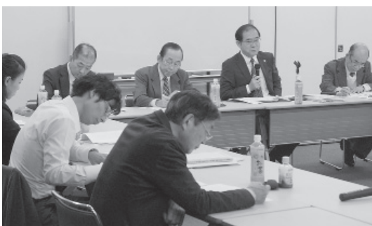
個別指導に帯同した弁護士らによる交流会